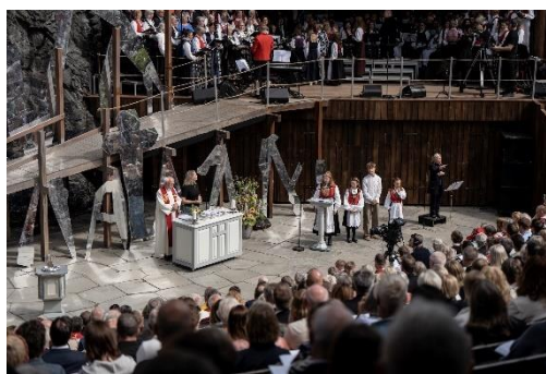
Frå jubileumsgudstenesta 2.juni i Moster amfi under 1000-årsmarkeringa for Kristenretten.

Å få vere med å skape noko er ei grunnleggjande drivkraft i oss menneske og noko som gjer det meningsfullt å vere i arbeid. 2024 er året då det vart gjort store investeringar, takka vere nye investeringsmidlar frå kommunen. Leikanger kyrkje vart totalrenovert og Leikanger kyrkjegard fekk nytt driftsbygg. Det er noko eige ved å følgje eit byggeprosjekt eller renoveringsprosjekt frå start til slutt og sjå prosjektet ferdig, til glede for mange.