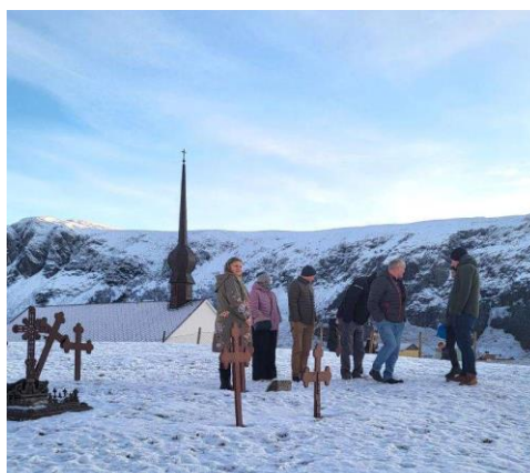
Fellesrådet får orientering om Ervik kyrkjegard.

Ervik kyrkjegard: Delar av gravplassen er eit freda kulturminne, og det er oppretta eige investeringsprosjekt for å sikre kyrkjegarden frå eventuelle erosjonsskadar, samt lage skilt og skjøtselsplan. Dette er eit prosjekt fellesrådet har i samarbeid med kommunen og fylkeskommunen. Det var synfaring med Vestland fylkeskommune i oktober. DK eigedom AS har leigd eit område av parkeringsplassen til minikafeen TÅR. Dette har fungert bra. Vidare er det enno mange utfordringar i Ervik i høve parkeringsplass, mykje turistar, søppelhandtering og bruk av sanitærbygget. Dette har og i år vore drøfta med tilsette i Stad kommune og i Vestland fylkeskommune. Gravplassen har eit sanitærbygg og eit klokketårn. Det har vore utført ein god del vedlikehaldsarbeid på stopulen/klokketårnet, på gjerdet rundt kyrkjegarden og i servicebygget.