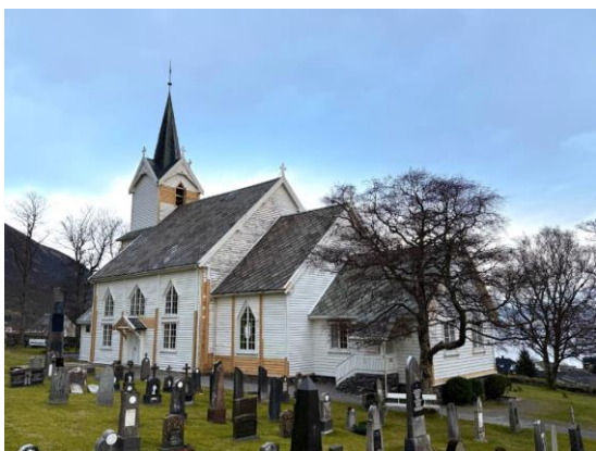
Frå renoveringsarbeidet i Leikanger kyrkje

Ervik Kyrkje: Kyrkja er i god stand men det måtte også i år gjerast små reperasjonar på taket. Brannslangen har fått dekke og fleire avvik på det elektriske anlegget er lukka. Ei av tårnlukene har fått nye hengsler.