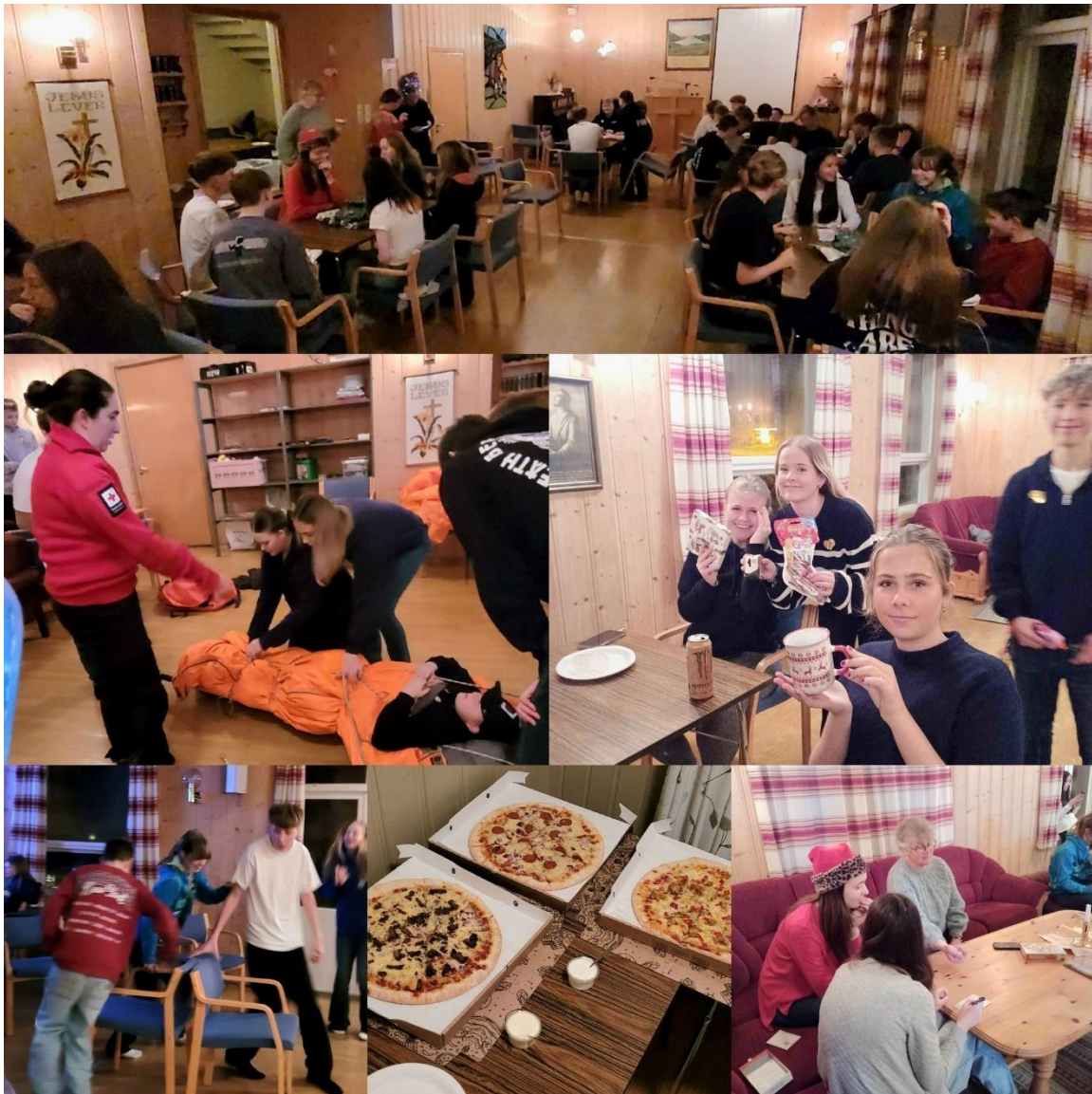
Glimt frå nattkafeen i Selje

Besøksteneste Totland sokn: Ein frivillig tok kontakt med sokneprest i Totland og meldte inn behov for besøksteneste i Totland sokn. Diakonimedarbeidar deltok i arbeidet med å undersøke og førebu. Ein har ikkje lukkast i å halde fram med dette arbeidet.